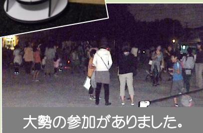
大勢の参加がありました。