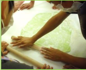
けっこう力が必要です。