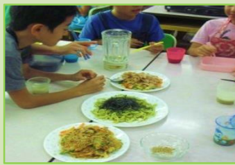
チヂミ、うどん、チャンプル、 ジュース(全てゴーヤ入り!) みんな完食です!

大切に育てたゴーヤは、たくさん実をつけ、調理実習をしておいしくいただきました。十二月のエコプロダクツでは、班ごとに来場された方々の前で、自分たちの活動を発表しました。