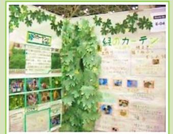
浜小展示ブース 力作です!