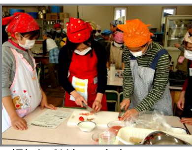
慣れた手付きの6年生

今注目の『米粉』を使ったかぼちゃのニョッキ・クリスピー唐揚・イチゴのムースを作りました。ニョッキはちよつと大人の味でしたが、みんな残さずおいしくいただきました。